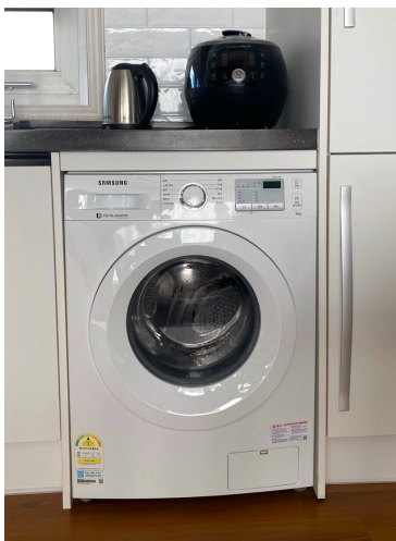
< 주방 안 >