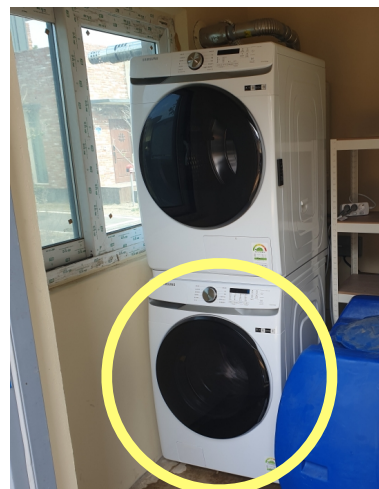
< 실외 창고 세탁실 >