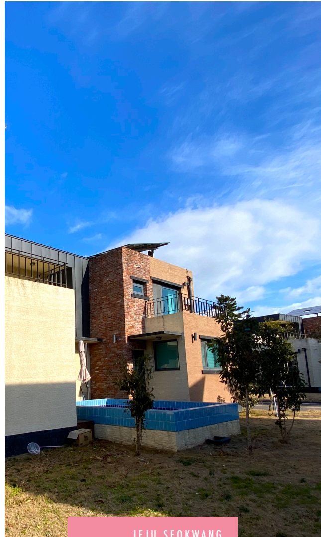
JEJU SEOKWANG HEALING HOUSE